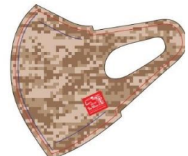
D:デジタルカモフラージュ (ベージュ)