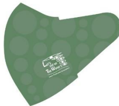
F:水イメージ (グリーン)