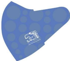
E:水イメージ (ブルー)